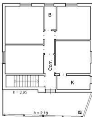
PIANO PRIMO H = 2,90